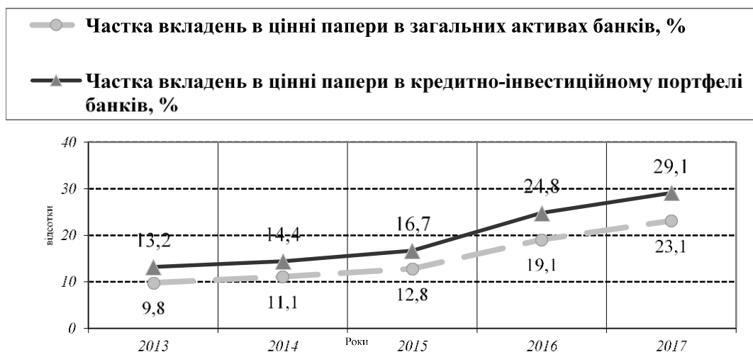
Рис. 2. Частки вкладень в цінні папери в загальних активах і кредитно-інвестиційному портфелі вітчизняних банків в 2013-2017 рр., %*